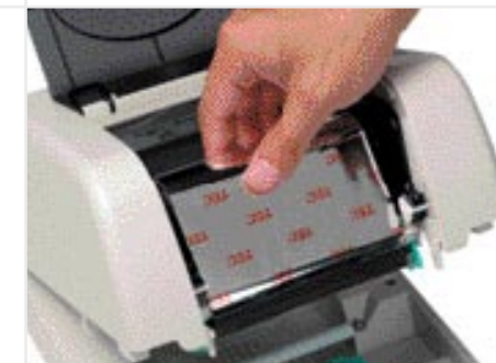
B-SV4T mit 300 m Farbbandlänge

Die B-SV4 Serie unterstützt Standard Bitmap-Fonts sowie individuelle Fonts und Grafiken. Aufgrund des automatisch umschaltenden Netzteils (100-240 V) passen sich die Drucker der B-SV4 Serie den lokal gegebenen Spannungsverhältnissen an. Für die Etikettendrucker der B-SV4 Serie wird ein kostenloser Windowstreiber angeboten, aber auch die Direktansteuerung mit der TEC Ascii Programmiersprache TPCL2 lite ist möglich.