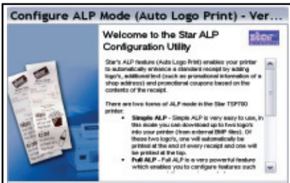
Leicht bedienbares AutoLogo™ Tool mit der Fähigkeit bis zu 15 Grafiken oder Coupons zu konfigurieren / downloaden, ohne das teure Software-Änderungen oder komplizierte Einstellungen erforderlich sind, dank einer einfach bedienbaren assistenzgestützten Software. Die gewünschte Grafik wird aufgeladen & identifiziert und anschließend werden die relevanten Coupons oder Grafiken ausgelöst