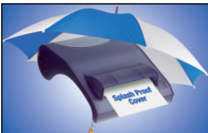
Optionale spritzwassergeschützte Abdeckung für Extraschutz