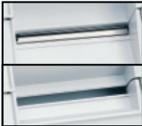
Modell mit Abrisskante und Modell mit Papierabschneider