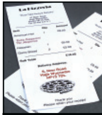
Zweifarbige Ausgabe - rot & schwarz oder blau & schwarz