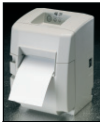
Tischoption für vertikalen Betrieb