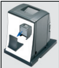
Optionaler dunkelgrauer Displaystand mit A5-Werbepostfunktion