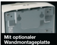
Mit optionaler Wandmontageplatte