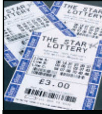
Hochwertige Barcodes für Coupons oder Tickets