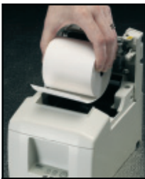
„Drop-In & Print“ Einfache Papierhandhabung